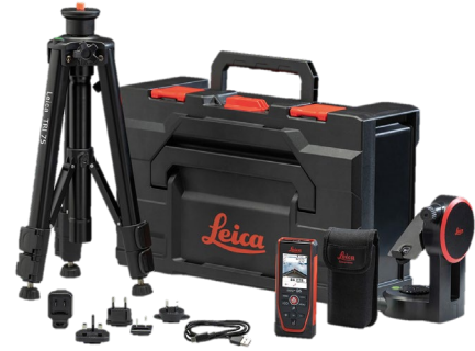
Leica DISTO™ D5-Paket Art. Nr. 950879

Leica DISTO™ D5, Tasche, USB-C auf USB-A Kabel, Handschleufe, Kurzanleitung, Garantiekarte, Sicherheitshandbuch, Kalibrierungszertifikat Silber