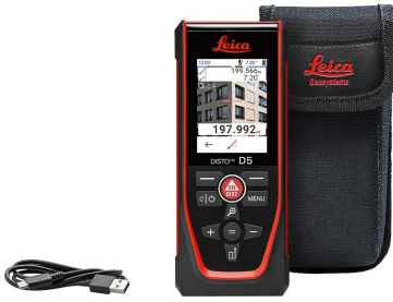
Leica DISTO™ D5 Art. Nr. 950908

Leica DISTO™ D5, Tasche, USB-C auf USB-A Kabel, Handschleufe, Kurzanleitung, Garantiekarte, Sicherheitshandbuch, Kalibrierungszertifikat Silber