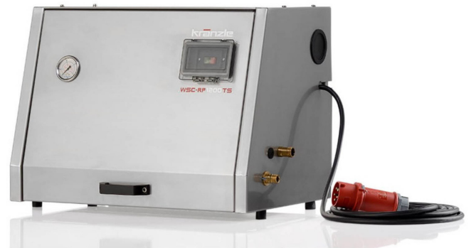
WSC-RP (mit Abdeckung)