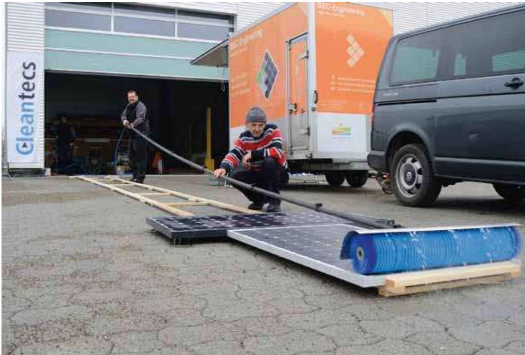
Abbildung 1: Darstellung des Modulreinigungsvorgangs mit Reinigungsgerät C700